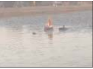
पहली किरण दिखते ही दुसरा अर्थ प्राप्त 06:06 बजे देकर समापन करेंगे।

कि छठ पर्व जो है वह एक प्राकृतिक पर्व जिसमे हमलोग सूर्य भगवान का पुजा करते है जो कि एक वास्तविक प्राकृतिक पर्व है अर्थात सूर्य जो हमलोग देखते हैं वो वास्तविक मे छठ पर्व के पावन अवसर का शुरुआत और समापन कुल चार दिनों मे होता है, नहाय खाय, खाना पहला अर्थ और दुसरा अर्थ तक आज सूर्य भगवान को हमलोग सारे श्रद्धालु सूर्यास्त होते ही पहला अर्थ संध्या 05:02 बजे देगें और कल सूर्योदय की