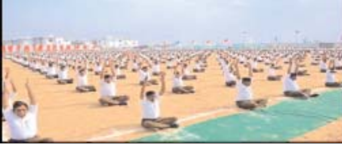
सामूहिक योग प्रदर्शन करते स्वं सेवक।