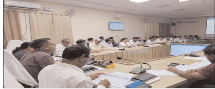
डीएम ने की संचारी रोग नियंत्रण अभियान के कार्यों की समीक्षा बैठक