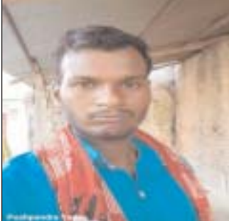
मृतक फाइल फोटो