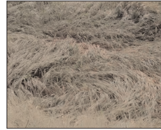
स्वतंत्र प्रभात संवाददाता

कोंच(जालौन) – क्षेत्र में मंगलवार की देर शाम आई तेज आंधी के साथ बेमौसम बारिश ने जहां एक ओर किसानों की चिंता बढ़ा दी, वहीं दूसरी ओर नगर की बदहाल जल निकासी व्यवस्था की पोल भी खोल कर रख दी। चंच मिट्टी की बारिश में ही सड़कों पर पानी बहने लगा और नालियां उफना कर गंदगी सड़कों पर बिखरने लगीं। तहसील के परिश्चोमरत इलाके के कई गांवों में ओलावृष्टि की भी खबरें हैं जिससे फसलें प्रभावित हुई हैं। इस समय खेती-किसानी का काम जोरों पर है। पिछले कुछ दिनों से मौसम ने जो पलटी मारी है वह किसानों की सैहत खराब करने वाली है। ऐसे में मंगलवार की देर शाम हुई आधे घंटे की मूसलाधार बारिश ने किसानों को रुला दिया है। फसल कटाई के समय आई यह बारिश किसानों के लिए संकट बन कर सामने आई है। क्षेत्र के