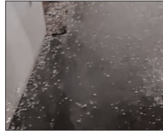
स्वतंत्र प्रभात संवाददाता