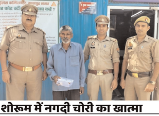
शोरूम में नगदी चोरी का खात्मा

छत काटकर शोरूम में चोरी करने वाला आरोपी गिरफ्तार, पुलिस ने भेजा जेल