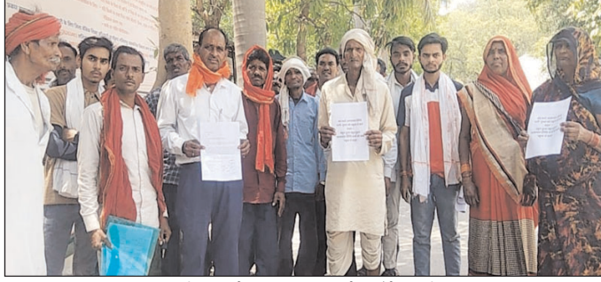
डीएम को शिकायत करने पहुंचे ग्रामीण

ललितपुर। जखौरा ब्लॉक अंतर्गत ग्राम पंचायत कारीपहाड़ी में स्थित प्राथमिक विद्यालय की प्रधानाध्यापक के खिलाफ ग्रामीणों और अभिभावकों ने गंभीर आरोप लगाए हैं। इस संबंध में जिलाधिकारी को एक प्रार्थना पत्र सौंपकर कार्रवाई की मांग की गई है। ग्रामीणों का आरोप है कि वर्तमान प्रधानाध्यापक का व्यवहार बच्चों और अभिभावकों के प्रति ठीक नहीं है। आरोप लगाया गया है कि कक्षा में बच्चों को बार-बार अपशब्द कहे जाते हैं और अपमानजनक भाषा का प्रयोग किया जाता है, जिससे बच्चों का मनोबल गिर रहा है। इसके चलते कई बच्चे डर के कारण विद्यालय आने से कतराने लगे हैं। अभिभावकों का कहना है कि विद्यालय का शैक्षिक वातावरण पूरी तरह प्रभावित हो चुका है। शिकायत करने पर भी