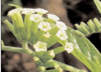
स्वतंत्र प्रभात संवाददाता