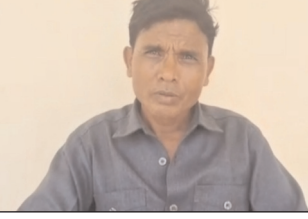
स्वतंत्र प्रभात संवाददाता