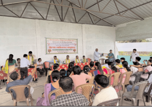
स्वतंत्र प्रभात संवाददाता