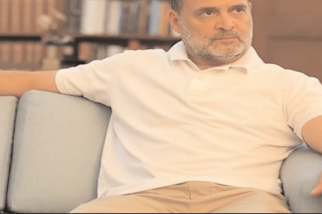
स्वतंत्र प्रभात संवाददाता