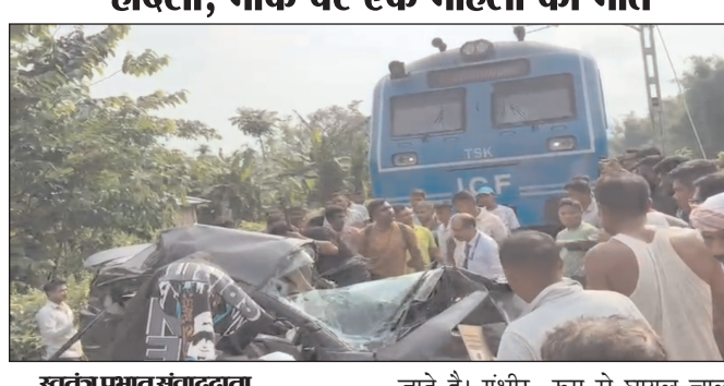
स्वतंत्र प्रभात संवाददाता

असम धेमाजी। आज दुपहर 2 बजे असम धेमाजी जिले की डेकापाम में लिडू- मुर्कोंगसेलेक डेमो ट्रेन पार करते समय एक भयानक दुर्घटना हुई। खबर अनुसार एक बोलने वाहन ने खुले रेल क्राॉसिंग पार करने की कोशिश करते समय ट्रेन ने जोरदार टक्कर मारी। टक्कर इतना भयानक था कि बोलने वाहन को 50 मीटर तक घसीट कर ले गया। मौके ही बर्दातात पर रीवा उपाधि के एक महिला की गाड़ी के अंदर ही मृत्यु हो