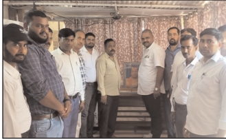
स्वतंत्र प्रभात संवाददाता