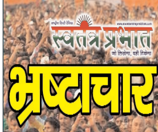
स्वतंत्र प्रभात संवाददाता

जनता का सवाल: 'जब हर स्तर पर निष्पत्ति और पारदर्शी तबादले किए जा रहे हैं, तो बाजार खाला कोतवाली में बरसों से जमे इन खास पुलिसकर्मियों पर मेहरबानी की कौन करेगा?'