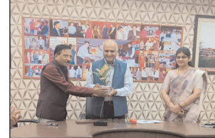
स्वतंत्र प्रभात संवाददाता

परिणामस्वरूप अनेक पर्यावरणीय कानूनों एवं नीतियों को मजबूती मिली है। उन्होंने भारतीय संविधान के राज्य के नीति-निर्देशक तत्वों (डीपीएसपी) तथा नागरिकों के मौलिक कर्तव्यों का उल्लेख करते हुए कहा कि पर्यावरण संरक्षण केवल सरकार की जिम्मेदारी नहीं, बल्कि प्रत्येक नागरिक का कर्तव्य भी है। कॉर्पोरेट क्षेत्र की भूमिका पर चर्चा करते हुए उन्होंने कहा कि आज व्यवसायिक संस्थान पर्यावरणीय उत्तरदायित्व के प्रति अधिक सजग हो रहे हैं तथा अपनी कार्यप्रणाली में सतत विकास के सिद्धांतों को शामिल कर रहे हैं। तेजी से बढ़ती जनसंख्या और प्राकृतिक संसाधनों पर बढ़ते दबाव को पर्यावरणीय क्षरण का प्रमुख कारण बताते हुए उन्होंने विकास और पर्यावरण के बीच संतुलन बनाए रखने की आवश्यकता पर बल दिया। उन्होंने विद्यार्थियों से अपने दैनिक जीवन में 'रिड्यूस, रीयूज और रीसायकल' के सिद्धांतों को अपनाने तथा 'यूज एंड थ्रो' संस्कृति से दूर रहने का आह्वान किया। कार्यक्रम के दौरान विद्यार्थियों ने पर्यावरण से जुड़े विभिन्न विषयों पर प्रश्न पूछे, जिनका कुमार ने विस्तारपूर्वक उत्तर दिया। यह संवादात्मक सत्र अत्यंत