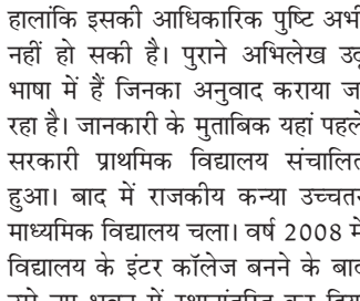
स्वतंत्र प्रभात संवाददाता

रेउसा ,बढ़नावा — विश्व पर्यावरण दिवस के अवसर पर ब्लॉक रेउसा के बढ़नावा स्वास्थ्य केंद्र में सामूहिक पौधारोपण कार्यक्रम आयोजित किया गया। केंद्र की सीएचओ, एएनएम, आशा व आंगनबाड़ी कार्यकर्ताओं ने मिलकर पेड़ लगाकर पर्यावरण संरक्षण की दिशा में एक सार्थक पहल की। सुबह करीब 10 बजे केंद्र परिसर में आयोजित इस कार्यक्रम में महिला स्वास्थ्य कार्यकर्ताओं ने एक स्वस्थ पर्यावरण के निर्माण के प्रति अपनी प्रतिबद्धता जताई। कार्यकर्ताओं ने एक पौधे को सामूहिक रूप से रोपित किया और भविष्य में ऐसे कार्यक्रमों को नियमित रूप से आयोजित करने का संकल्प लिया। कार्यक्रम में शामिल महिलाओं ने बताया कि पर्यावरण संरक्षण सिर्फ एक दिवसीय कार्यक्रम नहीं बल्कि निरंतर प्रयास का विषय है। उन्होंने स्थानीय स्तर पर पेड़ लगाने, जल संरक्षण और स्वच्छता जागरूकता फैलाने जैसे