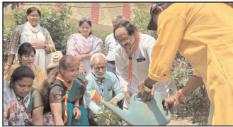
स्वतंत्र प्रभात संवाददाता

विश्व पर्यावरण दिवस के अवसर पर स्काउट और गाइड द्वारा वृक्षारोपण कार्यक्रम किया गया