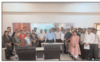
स्वतंत्र प्रभात संवाददाता