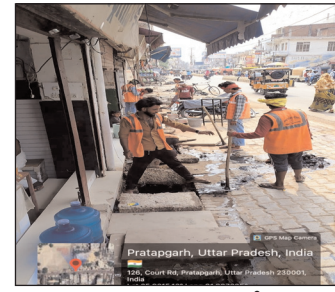
नगरपालिका का सफाई संवाद

प्रतापगढ़। केंद्र सरकार के 12 वर्ष पूर्ण होने के उपलक्ष्य में नगर पालिका परिषद बेल्हा, प्रतापगढ़ द्वारा 08 जून से 14 जून तक मलिन बस्तियों में विशेष स्वच्छता कार्यक्रम एवं जन-जागरूकता अभियान संचालित किया जा रहा है। अभियान के क्रम में 13 जून को जेआईसी परिसर एवं काशीराम कॉलोनी क्षेत्र में विशेष स्वच्छता अभियान चलाया गया। अभियान के दौरान सफाई कर्मचारियों की टीमों द्वारा एकरित्रित कूड़े का निस्तारण, चोक नालियों की सफाई तथा सार्वजनिक स्थलों की व्यापक सफाई का कार्य युद्धस्तर पर कराया गया।