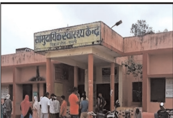
स्वतंत्र प्रभात संवाददाता

● जिले में अधिकतर सामुदायिक स्वास्थ्य केन्द्रों पर बाहर की दवा लिखी जा रही है गरीब मरीज दवा खरीदने में उनको पैसे जुटाना पड़ते हैं सरकार जबकि एमि में दवा वितरित करने का आदेश दिया है