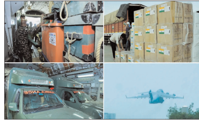
आपदा प्रभावित क्षेत्रों में तत्काल मेडिकल सुविधाएं उपलब्ध कराने में सक्षम हैं.

● मेडिकल उपकरणों में दो भीष्क वयूब भी शामिल हैं, जो एक तेजी से तैनात किया जा सकने वाला मॉड्यूलर फ़ील्ड अस्पताल है