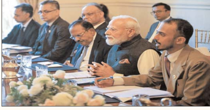
मोदी ने मेलबर्न में 'ऑस्ट्रेलिया-इंडिया सीईओ फोरम' और 'इकोनॉमिक रोडमैप बिजनेस' कार्यक्रम को संबोधित करते हुए यह बात कही। उन्होंने इन कार्यक्रमों को अपने ऑस्ट्रेलियाई समकक्ष एंथनी अल्बनीज के साथ संयुक्त रूप से संबोधित किया। भारत के विदेश मंत्रालय के अनुसार, इन कार्यक्रमों में भारत और ऑस्ट्रेलिया के प्रमुख मुख्य कार्यपालक अधिकारियों और उद्योग जगत के दिग्गजों ने हिस्सा लिया। सीईओ फोरम को संबोधित करने के बाद मोदी ने सोशल मीडिया मंच 'एक्स' पर लिखा, '2023 से इस फोरम ने उल्लेखनीय गति हासिल की है, जो हमारी आर्थिक साझेदारी में बढ़ते विश्वास को दर्शाती है।

नई दिल्ली (एजेंसी)। प्रधानमंत्री नरेन्द्र मोदी ने भारत-ऑस्ट्रेलिया आर्थिक साझेदारी को नई ऊंचाई पर ले जाने का बृहस्पतिवार को आह्वान करते हुए ऑस्ट्रेलियाई कारोबारियों से भारत में निवेश बढ़ाने और प्रस्तावित सीईसीए को शीघ्र अंतिम रूप देने की अपील की। मोदी ने मेलबर्न में 'ऑस्ट्रेलिया-इंडिया सीईओ फोरम' और 'इकोनॉमिक रोडमैप बिजनेस' कार्यक्रम को संबोधित करते हुए यह बात कही। उन्होंने इन कार्यक्रमों को अपने ऑस्ट्रेलियाई समकक्ष एंथनी अल्बनीज के साथ संयुक्त रूप से संबोधित किया। भारत के विदेश मंत्रालय के अनुसार, इन कार्यक्रमों में भारत और ऑस्ट्रेलिया के प्रमुख मुख्य कार्यपालक अधिकारियों और उद्योग जगत के दिग्गजों ने हिस्सा लिया। सीईओ फोरम को संबोधित करने के बाद मोदी ने सोशल मीडिया मंच 'एक्स' पर लिखा, '2023 से इस फोरम ने उल्लेखनीय गति हासिल की है, जो हमारी आर्थिक साझेदारी में बढ़ते विश्वास को दर्शाती है। इस संवाद में शामिल होने और हमारे आर्थिक संबंधों को नई ऊंचाइयों तक ले जाने के अपने दृष्टिकोण को साझा करने