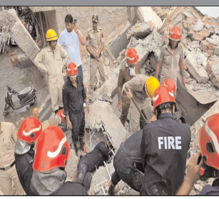
स्वतंत्र प्रभात संवाददाता

बाहरी दिल्ली । रोहिणी सेक्टर-16 में एक पांच मंजिला इमारत बुधवार शाम को धराशायी हो गई। इमारत के मलबे में दबने से मरने वालों की संख्या बढ़कर चार हो गई है। इमारत गिरने से मौके पर कई लोग दब गए थे, जिन्हें सुरक्षित बचाने के लिए रेस्क्यू चलाया गया। मलबा हटाने का काम अभी भी चल रहा है। संबंधित धाराओं के तहत FIR दर्ज की गई है।