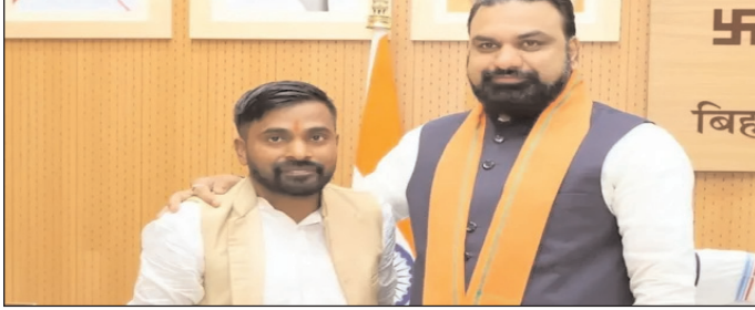
बांकीपुर विधानसभा उपचुनाव के लिए मुख्यमंत्री सम्राट चौधरी से आशीर्वाद लिया